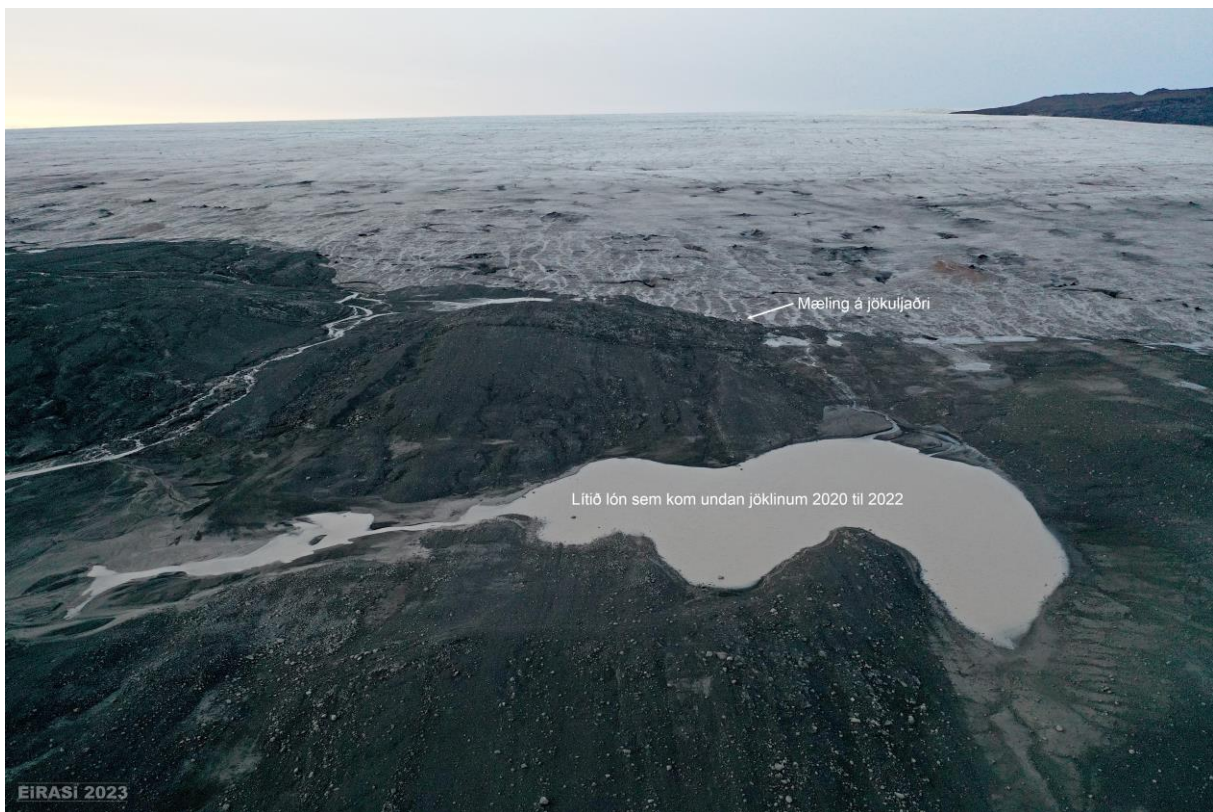
Mynd 2: Loftmynd af jökuljaðrinum. Lónið sem sést á myndinni er á mælinunni sem er miðað við í mælingunni en það kom undan jökli fyrir fáum árum og er enn til staðar. Það á svo á eftir að koma í ljós hvað það verður þarna lengi og jafn vel hvort það sé komið til að vera þarna til frambúðar sem lítið stöðuvatn.