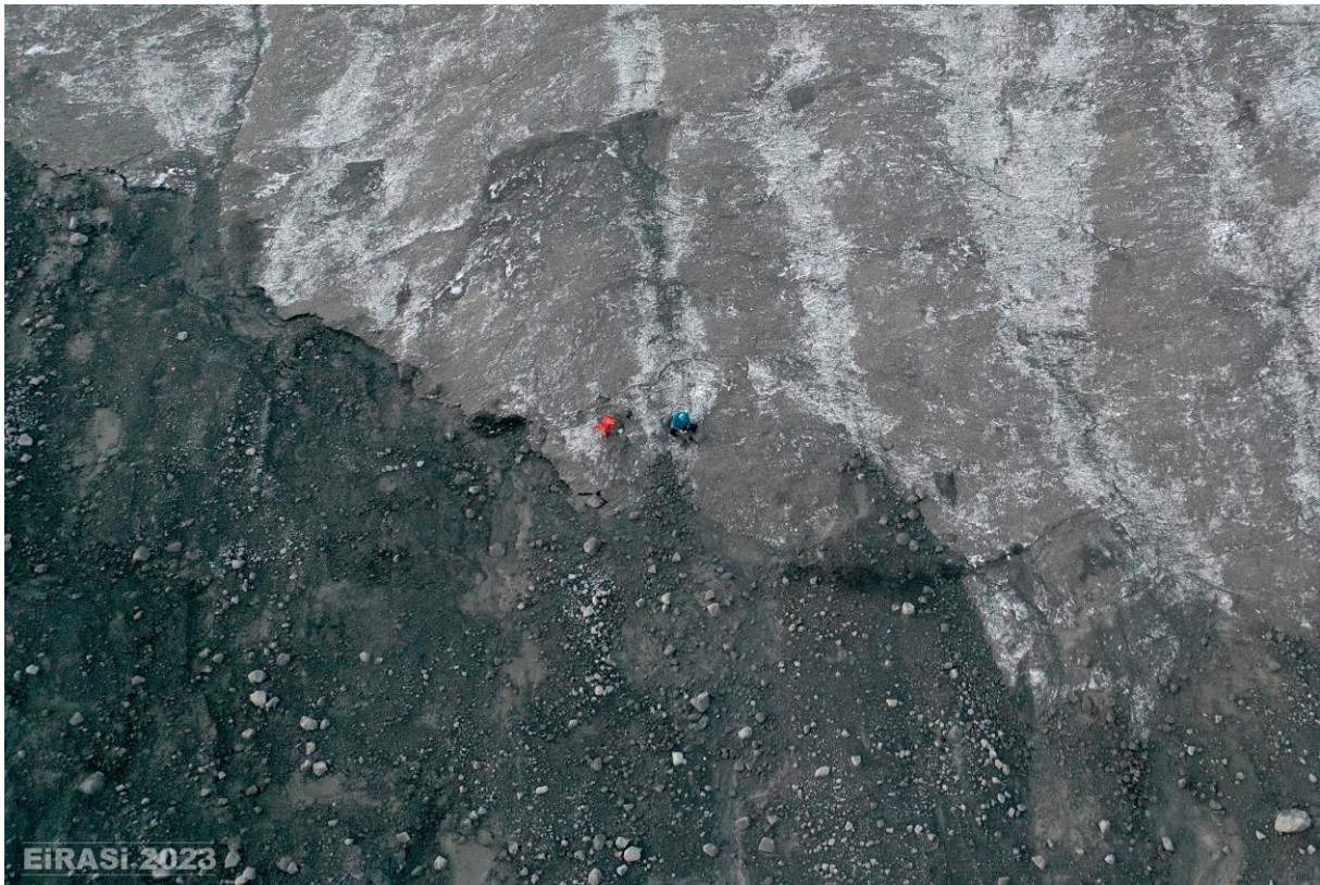
Á jökuljaðrinum sem var mjög greinilegur og auðmældur. Rauður bakpoki og mælingamaður að fljúga dróna.