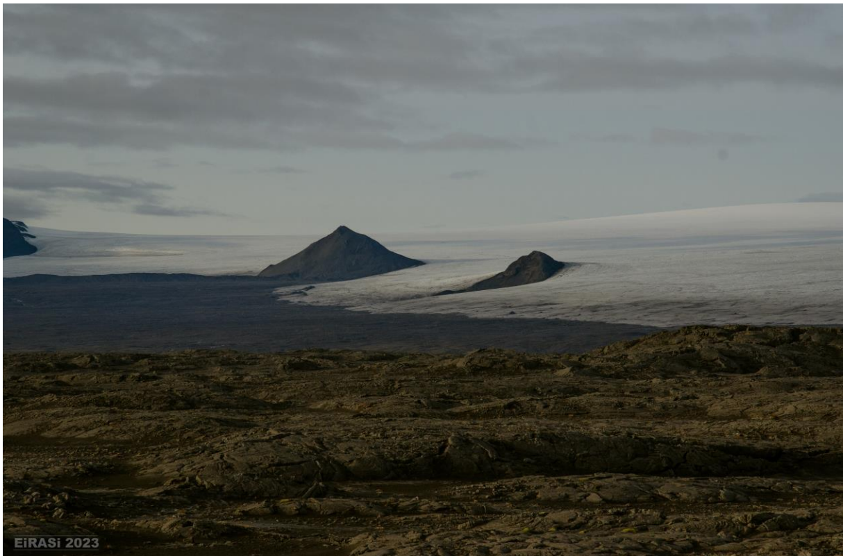
Séð inn að Vestari Hagafellsjökli frá Línuveginum þar sem gangan að jöklinum hefst. Móbergsstrýtan Klakkur er vinstra megin við miðju myndarinnar en sá hægra megin hefur verið kallaður Magnúsarklakkur.